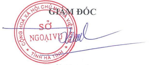
Thái Phúc Sơn